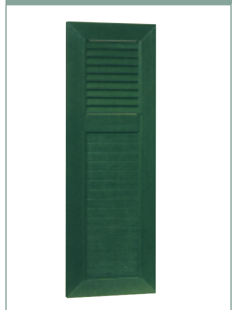
1/3 feste Jalousie, 2/3 geschlossene Stabfüllung mit Querfries

Freude am Morgen - Zierde am Tag - Schutz in der Nacht