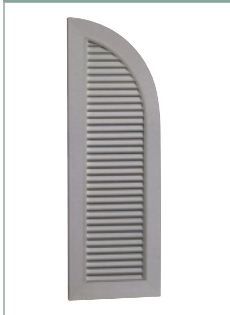
Feste Jalousie mit Rundbogen